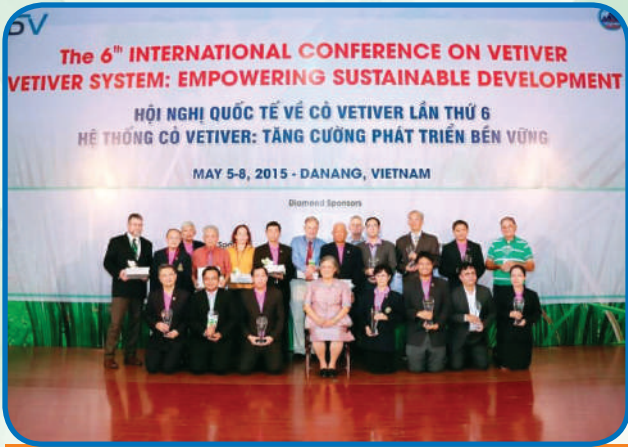
การประชุมหญ้าแฝกนานาชาติ ครั้งที่ 6 ณ ประเทศเวียดนาม