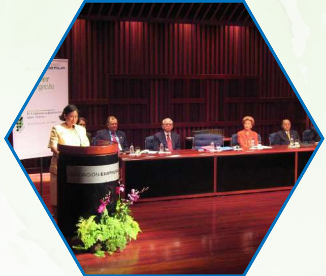
การประชุมทวิภาคีอาเซียน ครั้งที่ 4 ณ ประเทศเวเนซุเอลา