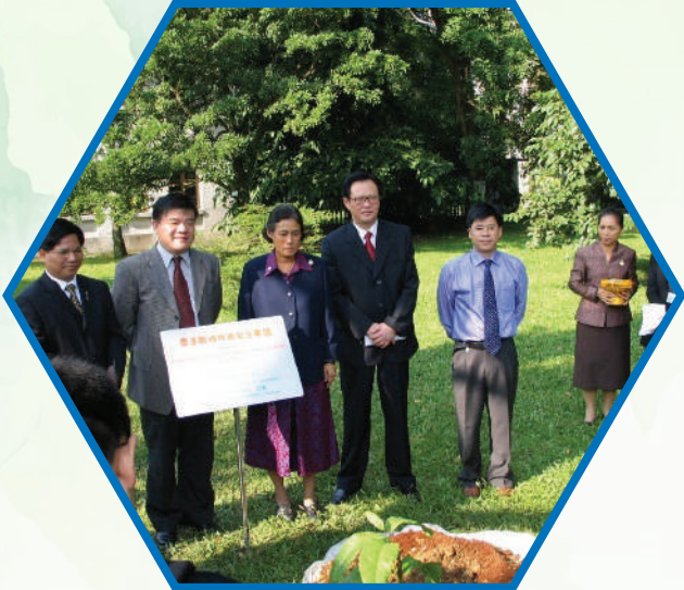
การประชุมทวิภาคีอาเซียน ครั้งที่ 3 ณ ประเทศจีน