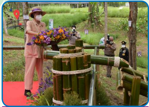
การประชุมหญ้าแฝกนานาชาติ ครั้งที่ 7 ณ จังหวัดเชียงใหม่ ประเทศไทย ทรงรตน้ำต้นหญ้าแฝก ณ ศูนย์ศึกษาการพัฒนาห้วยฮ่องไคร้ อันเนื่องมาจากพระราชดำริ อำเภอดอยสะเก็ด จังหวัดเชียงใหม่ เมื่อวันที่ 29 พฤษภาคม 2566