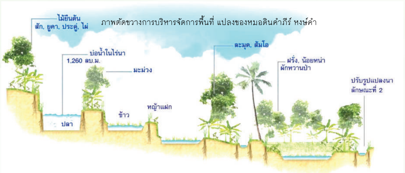
ภาพตัดขวางการบริหารจัดการพื้นที่ แปลงของหมอดินคำภีร์ หงษ์คำ

หมอดินคำภีร์ หงษ์คำ นำความรู้ต่าง ๆ มาวางแผนการปลูกพืชยึดหลัก ได้แก่ “ปลูกพืชตามดิน” โดยกำหนดพื้นที่ปลูกพืชคือ ตอนบน พื้นที่ ต้นน้ำ เน้นปลูกไม้ผล ไม้ยืนต้น แนวคิดที่นำมาใช้คือ ปลูกป่า 3 อย่าง ประโยชน์ 4 อย่าง สร้างแหล่งกักเก็บน้ำฝายชะลอน้ำเพื่อลดความเร็วของน้ำ กลางน้ำ ปลูกพืชเศรษฐกิจเพื่อจำหน่ายเป็นหลัก เช่น มะม่วง ส้มโอ ฝรั่ง และมีการทำคันคูน้ำเพื่อหมุนเวียนน้ำในพื้นที่ตอนกลางมากที่สุด เพิ่มการกระจายความชุ่มชื้น เกิดการใช้น้ำให้เกิดประโยชน์สูงสุด