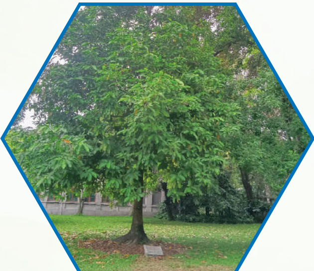
ต้นจำปีสิรินธร ( Magnolia sirindhorniae Noot & Chalermglin) ทรงปลูกเมื่อวันที่ 5 ตุลาคม 2546 ณ The South Botanical Garden, Chinese Academy of Science