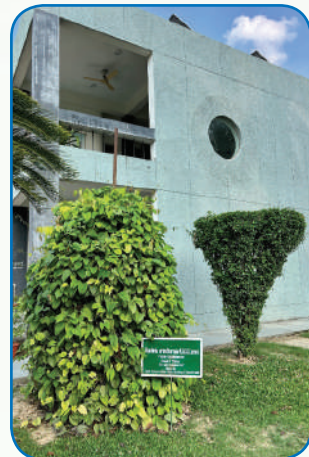
ต้นจำปีสิรินธร ( Magnolia sirindhorniae Noot & Chalermglin) ทรงปลูกเมื่อวันที่ 27 ตุลาคม 2554 ณ The Central Institute of Medicinal and Aromatic (CSIR)