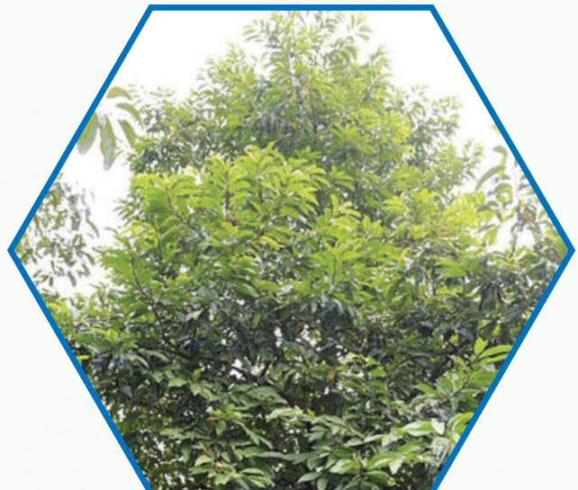
ต้นจำปีสิรินธร ( Magnolia sirindhorniae Noot & Chalermglin) ทรงปลูกเมื่อวันที่ 26 ตุลาคม 2549 ณ The Caracas Botanical Garden