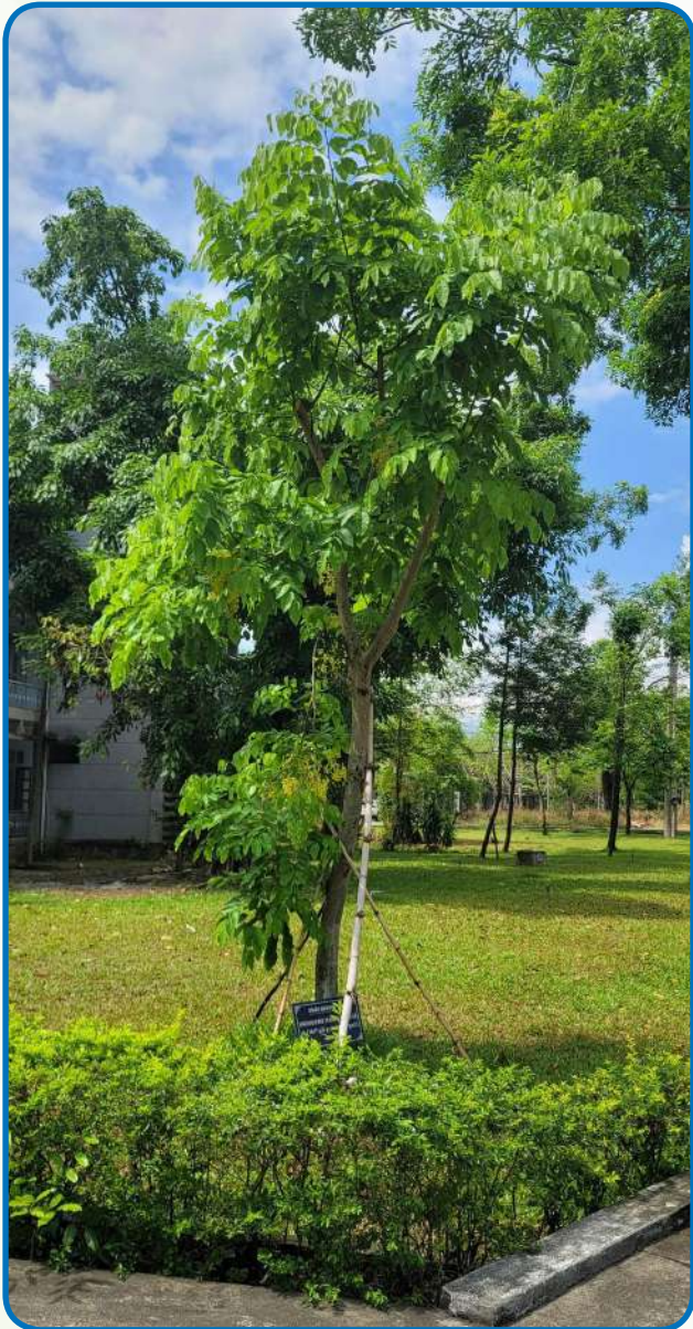
ต้นราชพฤกษ์ (Golden Shower) ทรงปลูกเมื่อวันที่ 5 พฤษภาคม 2558 ณ Danang University